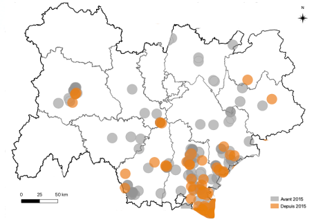
Répartition et abondance des observations de Chazara briseis en Auvergne-Rhône-Alpes

Plantes nourricières: imagos peu discriminants, chardons, scabieuses, centaurees et œillets sont réputés attractifs.