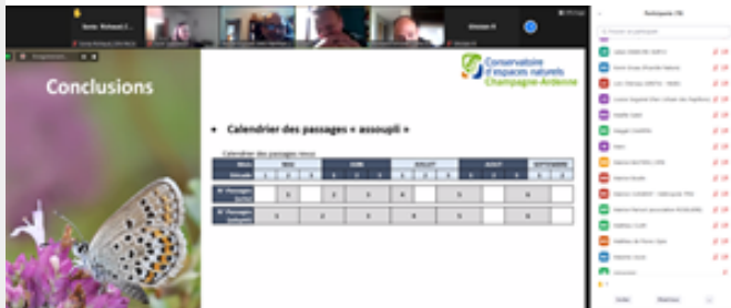
Atelier visio-thématique "Protocole et analyses"

Le premier atelier visio-thématique du PNA a permis d'échanger sur Chazara briseis (l'Hermitte), le compte-rendu est disponible.