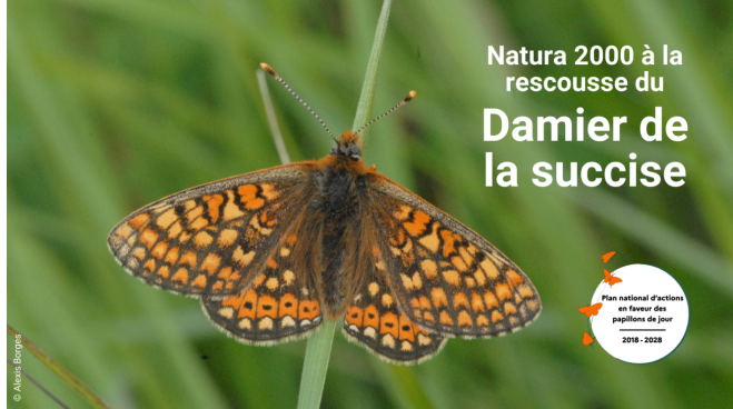
Euphydryas aurinia - Alexis Borges

S'ajoutent à cette vidéo, les vidéos sur le Semi-apollo, le Cuivré de la bistorte, l'Hespérie de la ballote et l'Apollon, celle sur la Bacchante est toujours disponible.