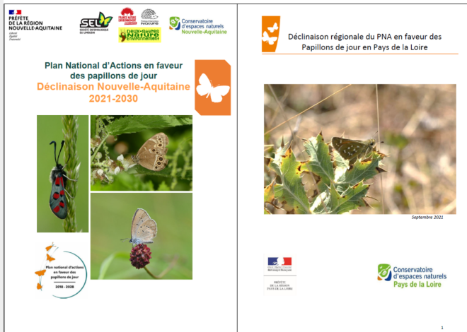
Plans régionaux d'actions

Rendez-vous en septembre 2022 pour le prochain atelier, si vous souhaitez recevoir l'invitation, envoyez votre demande ici .