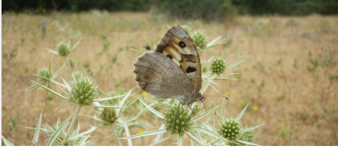
Chazara briseis - Stéphane Jaulin