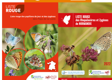
PRA Île-de-France Papillons / LR Pays de la Loire LR Normandie

La déclinaison du PNA pour la région Île-de-France en faveur des papillons de jour a été publié en mai 2022. Les espèces prioritaires de la région ont été regroupées par milieux à conserver, les actions de conservation auront un effet plus important sur ces cortèges.