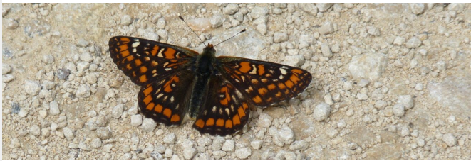
Euphydryas maturna - Claude Voinot

Un groupe de travail s'est réuni début juillet pour réfléchir au suivi commun du Damier du frêne. Des acteurs du Parc national de forêts et d'associations du Centre-Val de Loire ont échangé sur l'état des populations sur leur territoire, le compte-rendu est disponible .