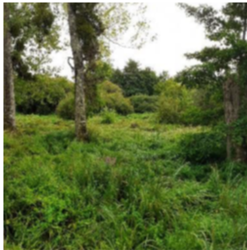
© Parcelle abandonnée - Le Peu

Regagner de l'habitat favorable sur les zones sans gestion et adapter la gestion sur les parcelles utilisées.