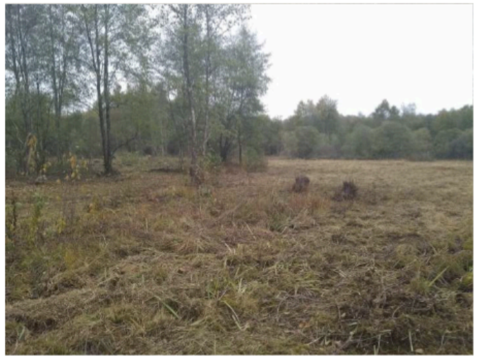
Travaux de réouverture du milieu avec un câble-mât et parcelle rouverte par la FDC 25

Fiche réalisée par l'animation du PNA en faveur des papillons de jour.