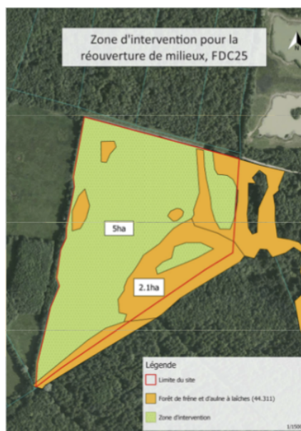
Zone ouverte par la FDC 25

Le marais de Saône joue un rôle essentiel dans l'alimentation de la source d'Arcier, ressource stratégique majeure utilisée pour l'alimentation en eau potable de la ville de Besançon. Toutefois, il a connu au cours du XXème siècle d'importantes modifications altérant ses fonctionnalités hydrauliques, écologiques et l'identité paysagère du site. La fermeture du milieu, au détriment des cortèges inféodés aux milieux ouverts humides, pousse à la volonté de réouverture des sites.